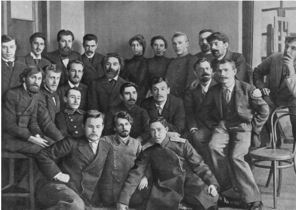
А. І. Куїнджі з групою своїх учнів, 1896 р.